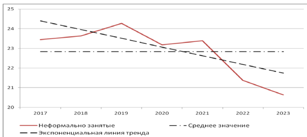
Рис. 1. Неформальная занятость за 2017–2023 гг., процент к общей численности занятых (составлен автором по [5–11])

На рис. 1 представлена экспоненциальная линия тренда неформальной занятости, согласно которой существует тенденция уменьшения показателей численности занятых в неформальном секторе в рассматриваемый период.